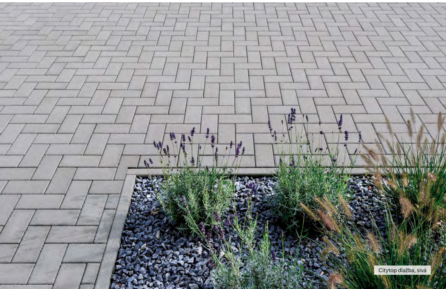
Citytop dlažba, sivá