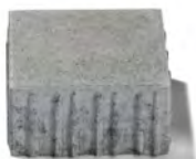
20 x 20 x 8 cm len sivá, červená