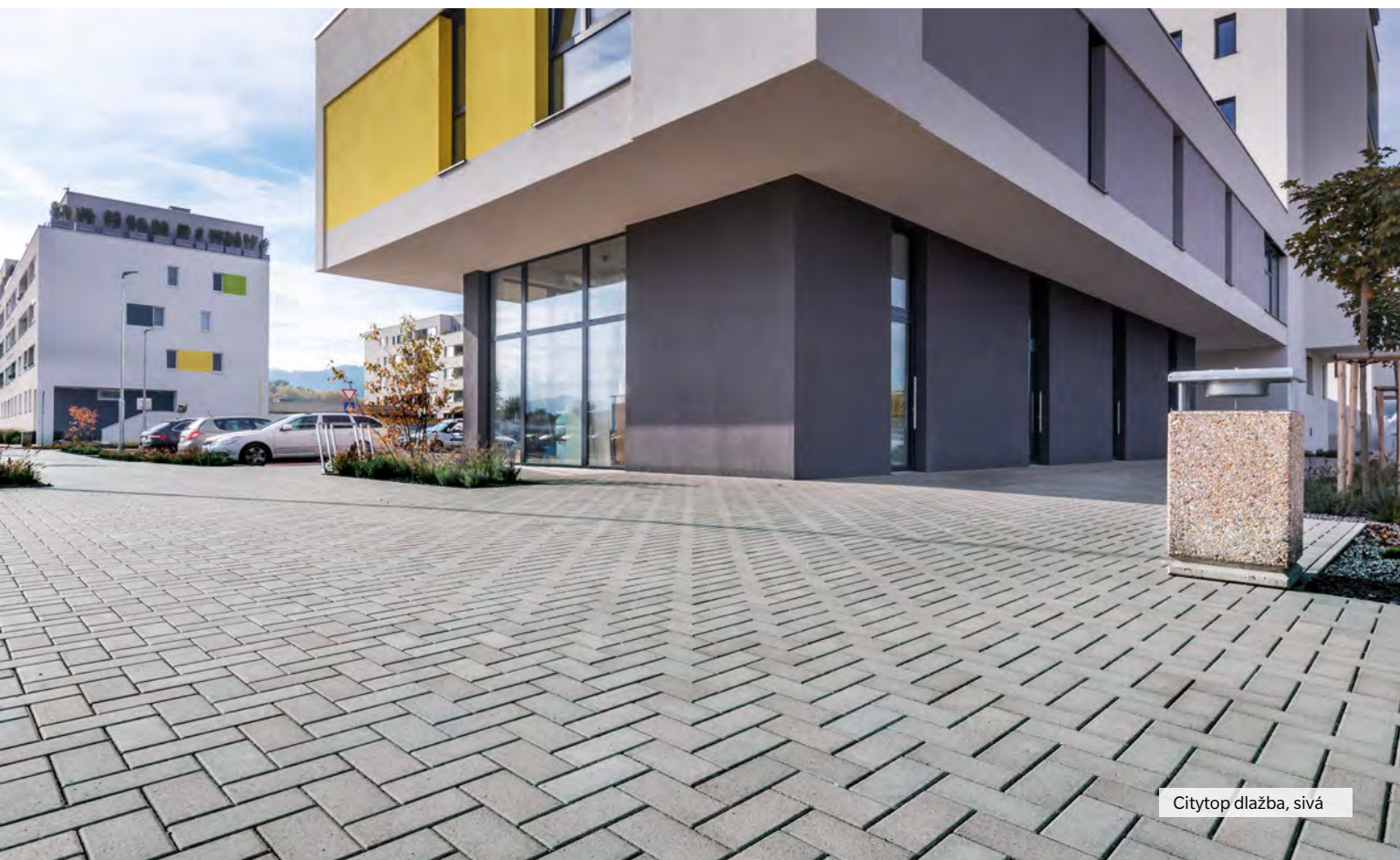
Citytop dlažba, sivá