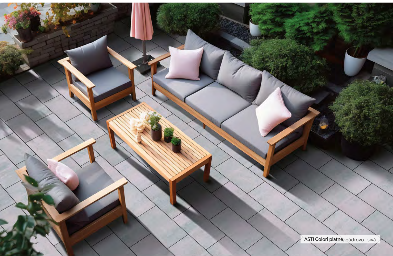
ASTI Colori platne, púdrovo - sivá