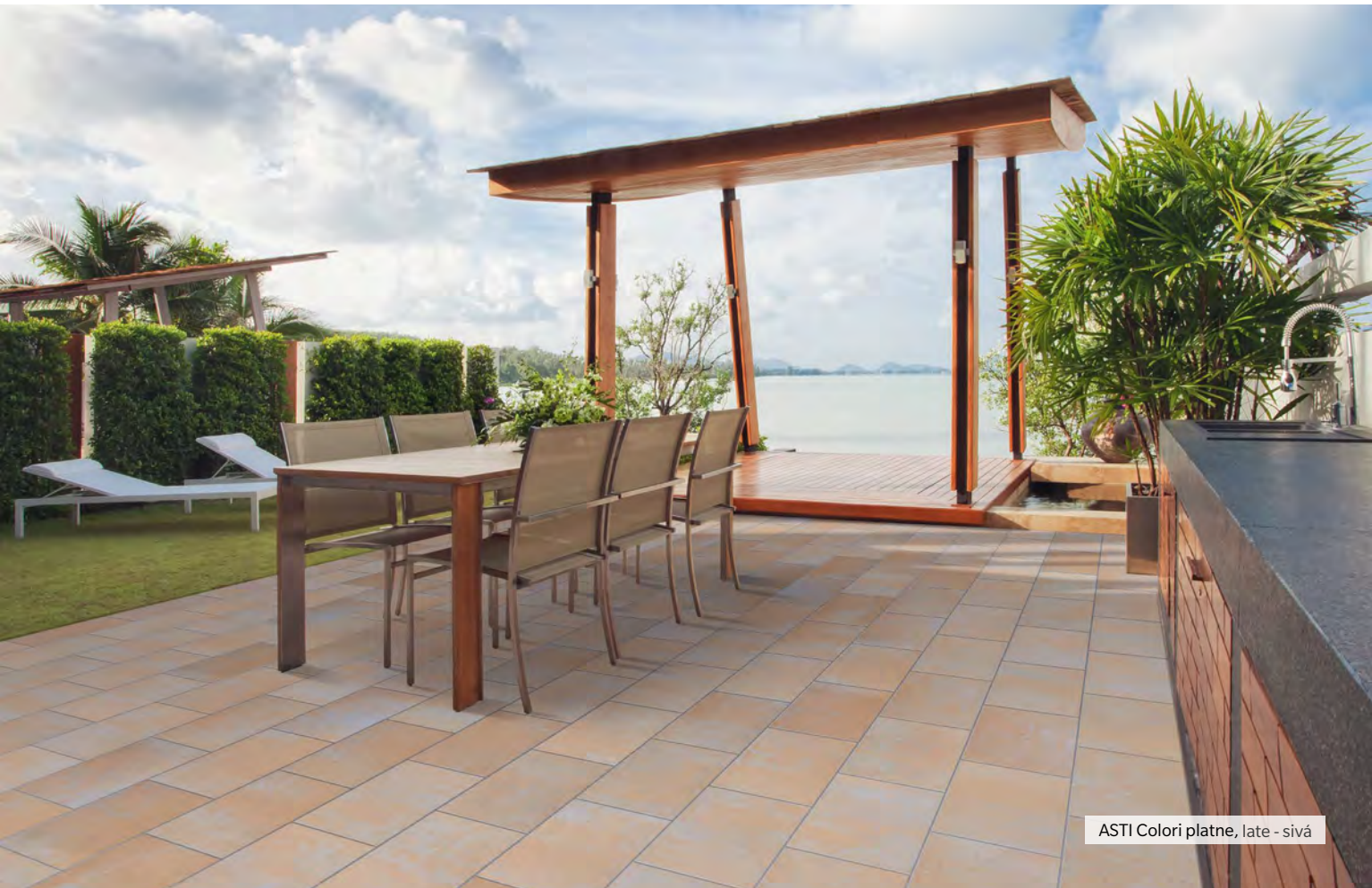
ASTI Colori platne, late - sivá