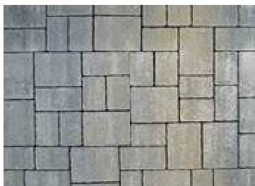
Uloženie na palete