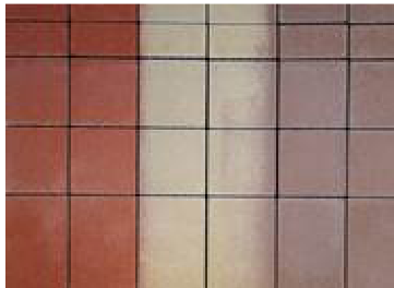
Uloženie na palete