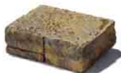
Mountain Block štiepatelný blok formát: 29,5 x 22,5 x 10 cm