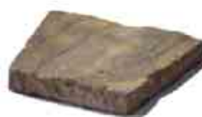
Mountain Block krycia platňa klinovitá formát: 30 x 22,5 x 25 x 4 cm