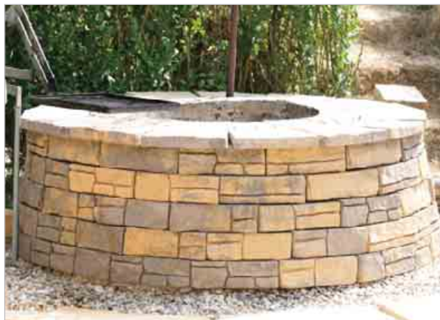
Stav po rekonštrukcii