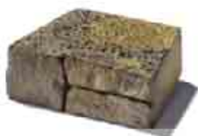
Mountain Block plný blok klinovitý formát: 29,5 x 22,5 x 10 cm