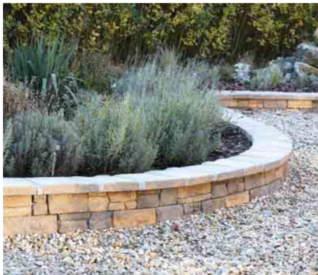
Stav po rekonštrukcii