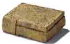
Mountain Block rohový prvok formát: 29,5 x 22,5 x 10 cm