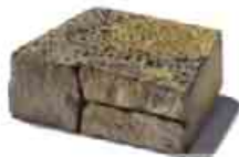
Mountain Block plný blok klinovitý formát: 29,5 x 22,5 x 10 cm