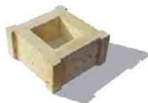
Bradstone Travero múr prvok pre stĺp formát: 30 x 30 x 15 cm