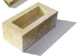
Bradstone Travero múr základný prvok formát: 40 x 20 x 15 cm