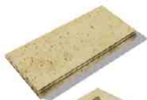
Bradstone Travero múr krycia platňa pre múr formát: 50 x 23 x 5 cm