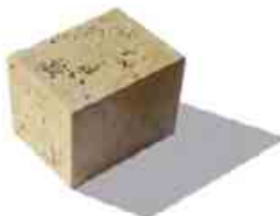
Bradstone Travero múr polovičný prvok formát: 20 x 20 x 15 cm