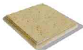
Bradstone Travero múr krycia platňa pre stĺp formát: 35 x 35 x 5 cm