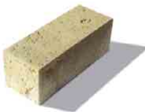
Bradstone Travero múr krycí prvok formát: 40 x 20 x 15 cm