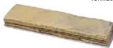
Madoc krycia platňa formát: 47,5 x 12,5 x 4 cm