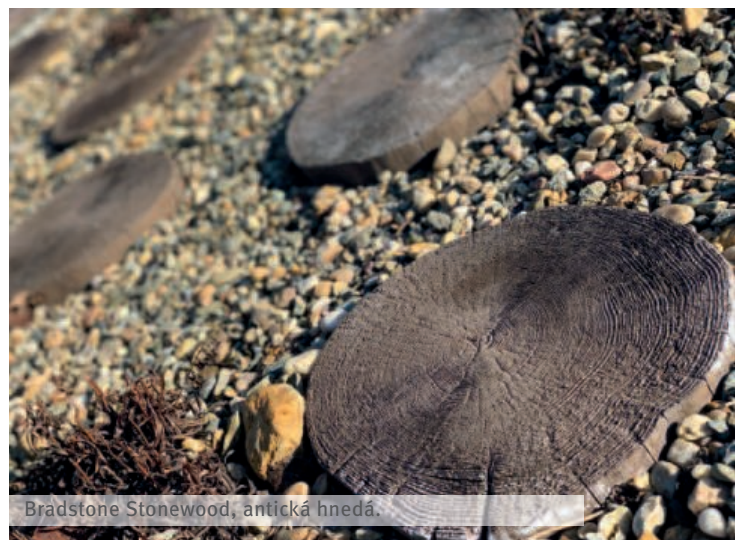
Bradstone Stonewood, antická hnedá.